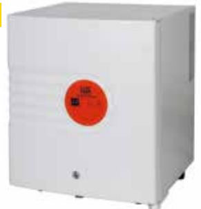
LLG-uniINCUB 28 Cool