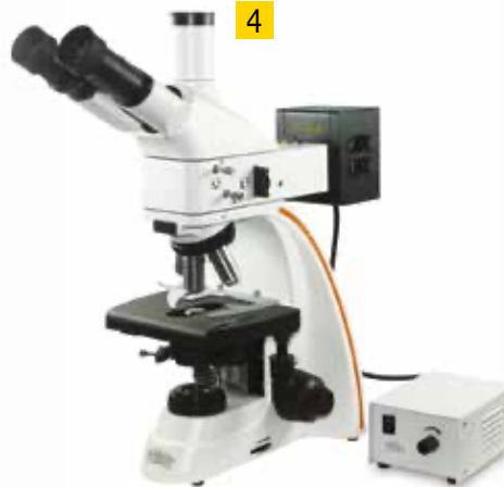
B6 + epifluorescenza